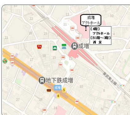
成増 アクトホール

成増 アクトホール 東京都板橋区成増3-11-3-405 ●東武東上線 成増駅北口 徒歩1分 東京外口有楽町線 地下鉄成増駅下車 出口5より徒歩3分